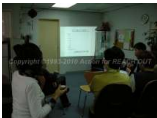
(個人財務管理講座, 1/2010)